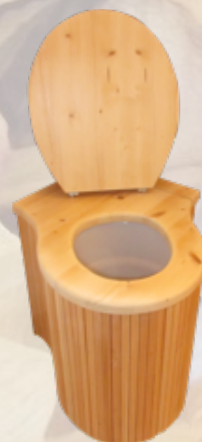
Détail lames Kayak

Conditions de vente : délais de livraison de 6 à 7 semaines. Frais de livraisons en suppléments pour certains articles (ex. gamme separett). Biocapi Sàrl se réserve le droit d'adapter ses prix en fonction des cours du change et fluctuations des tarifs de frêt.